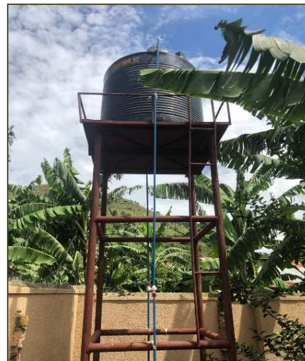
Bild: Wassertank bei der Station

Unser Ansporn ist es auch die humanitäre Hilfe zu erweitern, sofern dies die Spendeneingänge ermöglichen. So unterstützen wir ebenfalls ein uns bekanntes Waisenhaus, Straßenkinder, sowie eine Grundschule und befreundete Pfarreien in Uganda.