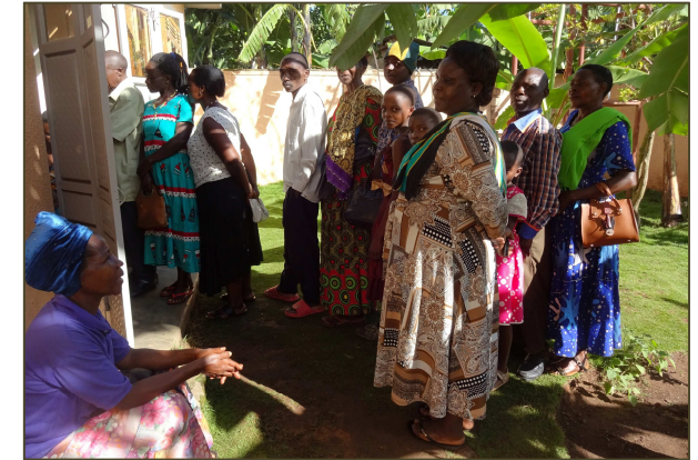
Bild: Patienten warten im Freien