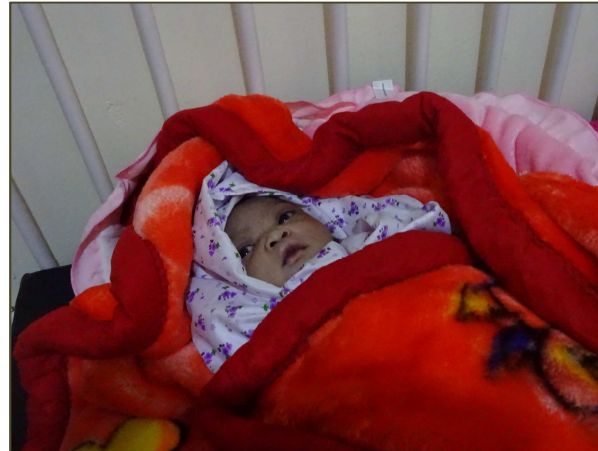
Bild: Neugeborenes April 2023