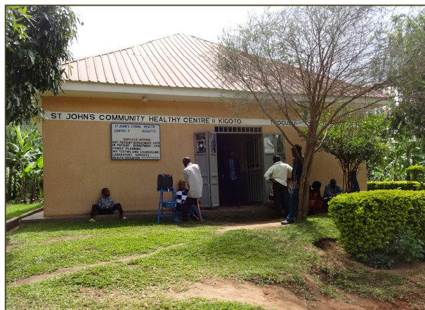
Bild: Gesundheitsstation 2023